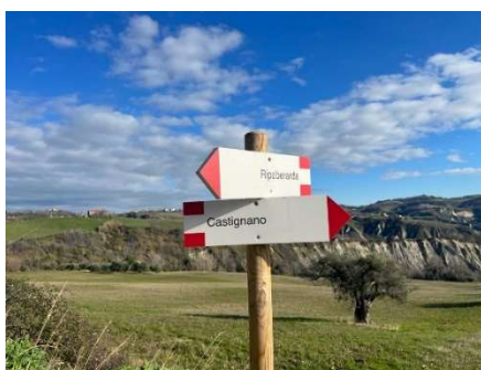
Alcuni esempi dei percorsi