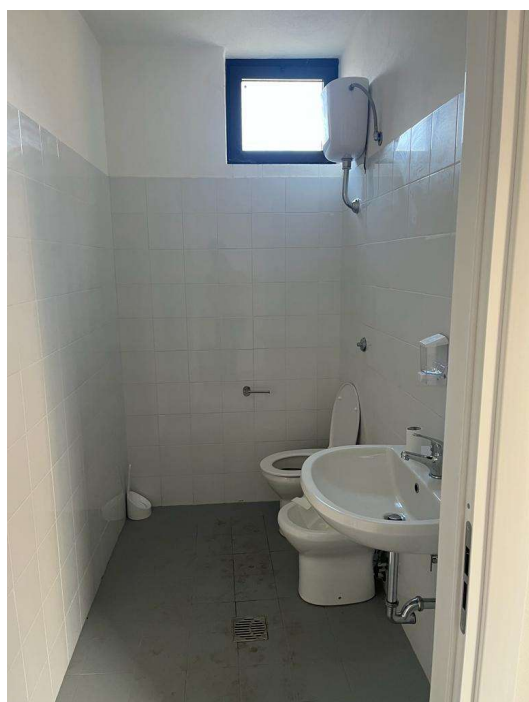
Il bagno all'interno della struttura